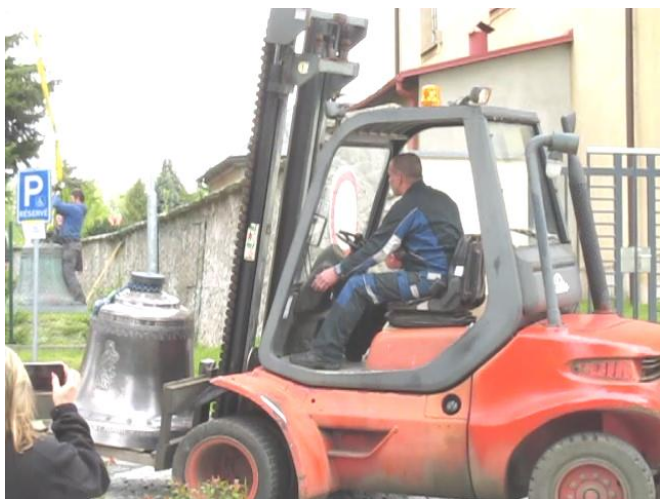
6. přivezení nového hlavního zvonu bl. PANNA MARIA z kostela