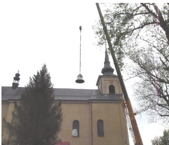
8. vyzdvižení do věže kostela