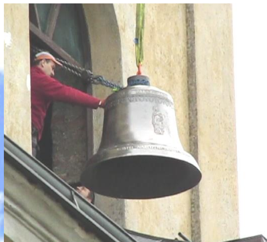
9. před oknem v 10:20

4.6.2020 čtvrtek obnoven Mariánský sloup, Starom. nám., Praha, posvěcen sobota 15.8.2020 na zvonu je reliéf Panny Marie IMMACULATY-Neposkrvněné dle její sochy nad svatostánkem*)